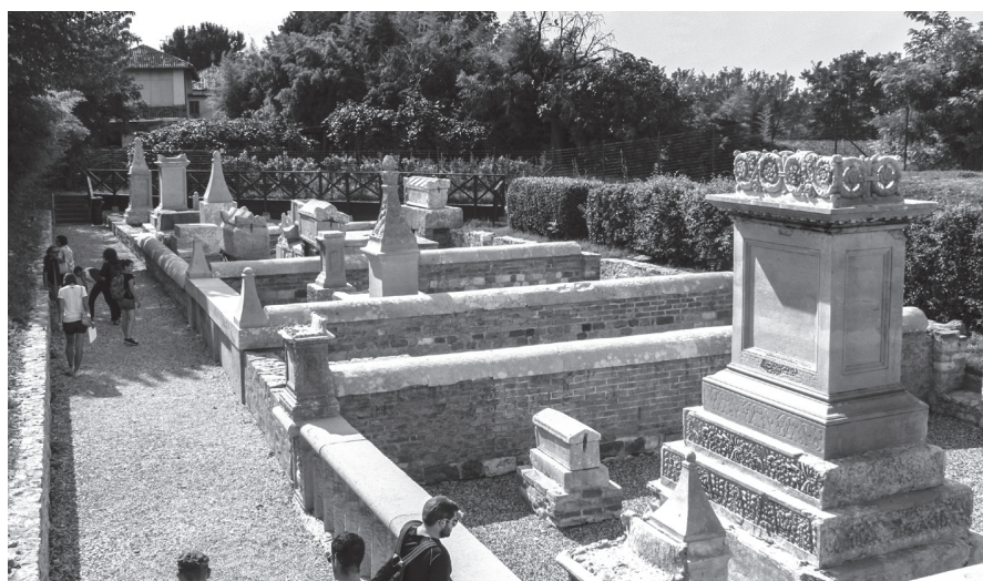
Abb. 7. Aquileia, Blick über den sepolcreto an der (modernen) via Annia. Im Vordergrund Grabbezirk 1 mit Primärgrabmal und einigen, auf verschiedenen Höhen positionierten Sekundärgrabmälern, bei denen versucht wurde, die einstige Höhenlage möglichst originalgetreu wiederzugeben. Die Ausgrabungsbefunde lassen annehmen, dass sich in jedem Grabbezirk weit über 20 sekundäre Grabstellen befanden.