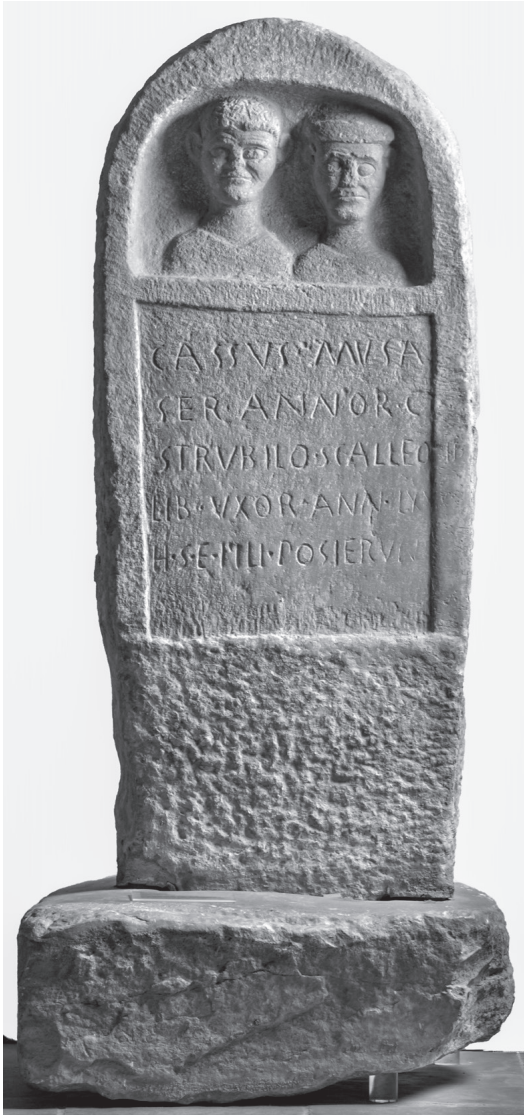
Abb. 1. Grabstele für den Sklaven Cassus und seine freigelassene Gattin Strubilo. FO Wiener Neustadt / A. ( lupa.at/425 ).