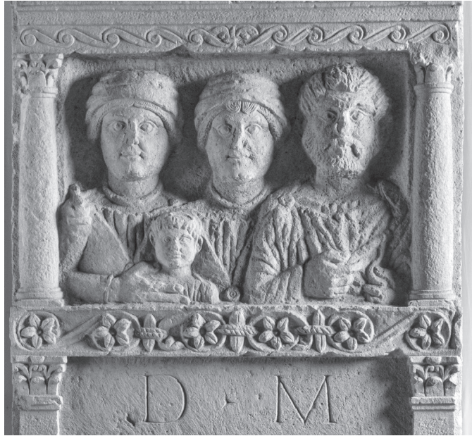
Abb. 4. Ausschnitt aus Abb. 3. Ohne Kenntnis der Inschrift würde man die dargestellten Personen nicht für Sklaven, sondern für peregrine Einheimische halten.

Aber immerhin erkennt man auf Abb. 6, dass in der Mitte knapp hinter der Frontmauer des Grabbezirks ein monolithischer Sockel liegt, 9 auf dem sich, wohl in situ , ein monumentales, wohl mit Marmor umkleidetes Grabmal, wahrscheinlich eine Ädikula, erhob. Flankiert wird es von zwei Grabaltären, die sich, auch ohne Inschrift deutlich sichtbar, der Grabädikula unterordnen. Dieser Familiengrabbezirk bildet also die soziale Struktur innerhalb der Familie ab, an deren Spitze der pater familias bzw. patronus 10