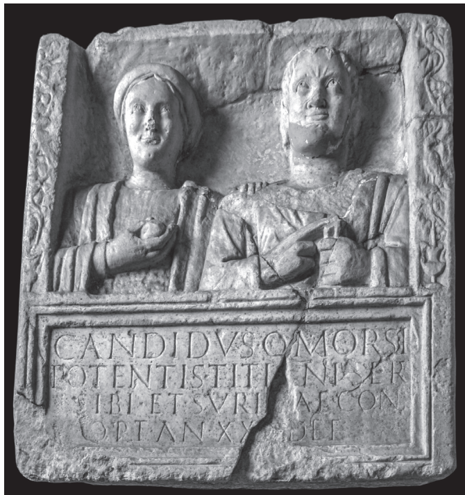
Abb. 5. Grabplatte des Sklavenehepaars Candidus und Surilla. Einheimisch gekleidete Frau mit Apfel Ehemann mit Schriftrolle, die Rechte im sog. Schwurgestus. FO wohl Flavia Solva (lupa.at/1229).