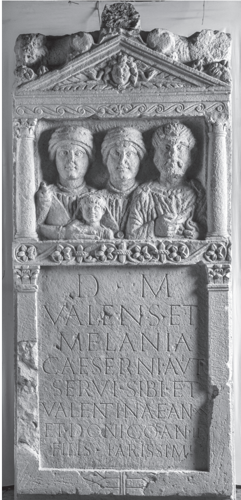
Abb. 3. Sklavenfamilie mit zwei Kindern. Beide Frauen tragen einheimische Tracht und reichen Schmuck, der Mann eine Peitsche. FO Donji Cehi / HR (lupa.at/8816).

Aber immerhin erkennt man auf Abb. 6, dass in der Mitte knapp hinter der Frontmauer des Grabbezirks ein monolithischer Sockel liegt, 9 auf dem sich, wohl in situ , ein monumentales, wohl mit Marmor umkleidetes Grabmal, wahrscheinlich eine Ädikula, erhob. Flankiert wird es von zwei Grabaltären, die sich, auch ohne Inschrift deutlich sichtbar, der Grabädikula unterordnen. Dieser Familiengrabbezirk bildet also die soziale Struktur innerhalb der Familie ab, an deren Spitze der pater familias bzw. patronus 10