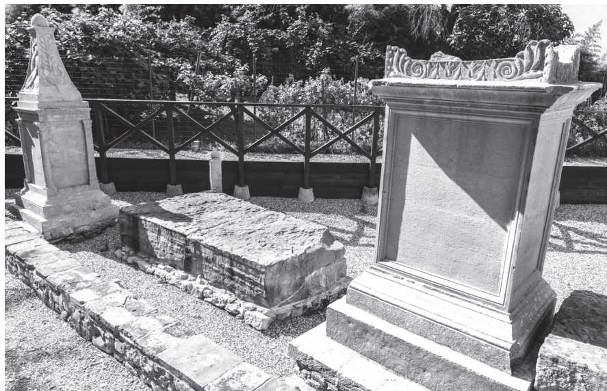
Abb. 6. Aquileia, sepolcreto an der (modernen) via Annia, Grabbezirk 5. In der Mitte der monolithe Sockel des einst mit Platten verkleideten Primärgrabmals, auf beiden Seiten je ein Grabaltar als Sekundärgrabmal.

stand. Zu seiner Seite und als nächste unter ihm standen die Eigentümer der Grabaltäre, wohl Freigelassene.